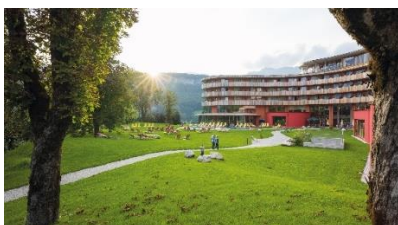
Vivea Hotel Bad Goisern